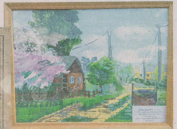
Работа з конкурсу.

Назіраючы, з якой цікавасцю глядзелі згаданы відэаролік наведвальнікі музея — простыя цімкаўляне, якія завіталі на свята (і якія, дарэчы, маглі б стаць прататыпамі літаратурных твораў), я не спыналася яны пакідаць устаноўу пасля завяршэння мерапрыемства, звярнуліся да аднаго з іх з просьбай падзяліцца ўражаннямі ад убачанага і пачутага.